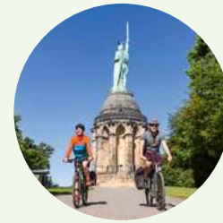
Kulturgeschichte 3: Deutschlands kulturelle Mitte

Entdecke in den „Kulturgeschichten“, die sich als 2- bis 3-tägige Radtouren gestalten, die Vielfalt der Regionen mit ihren eindrucksvollen Natur- und Kulturhighlights. Sie machen die Geschichte Europas erlebbar.