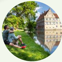
Kulturgeschichte 1: Schlösser, Burgen, Landidylle