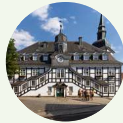
Kulturgeschichte 2: Historische Städte erleben