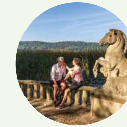
Kulturgeschichte 6: Welt-Metropole & lebendige Landkultur