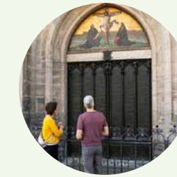
Kulturgeschichte 5: UNESCO-Welterbe er-fahren