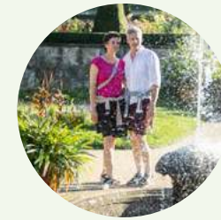
Kulturgeschichte 4: Prominente Parks & Gärten