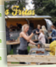
Vreden, LUST Foodtruck Festival

Mehr Veranstaltungshinweise bei den jeweiligen Touristinformationen.