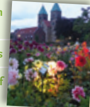
Legden, Dahliendorfmarkt